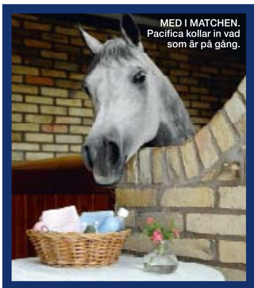
MED I MATCHEN. Pacifica kollar in vad som är på gång.